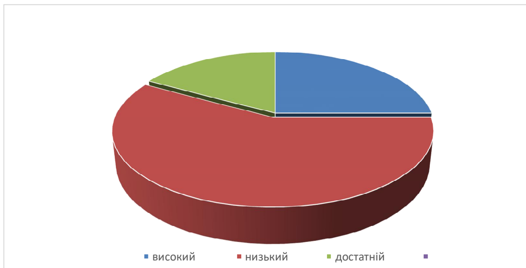
Рис. 1 Рівень розвитку економічної культури громадян України

Проведений нами моніторинг питання розуміння громадянами України особливостей сучасних соціокультурних перетворень, розвитку світу та, зокрема, власної країни виявив, що відсоток громадян із низьким рівнем економічної культури становить 58 %, із достатнім – 17 %, із високим – 25 % від опитаних респондентів (рис. 1).